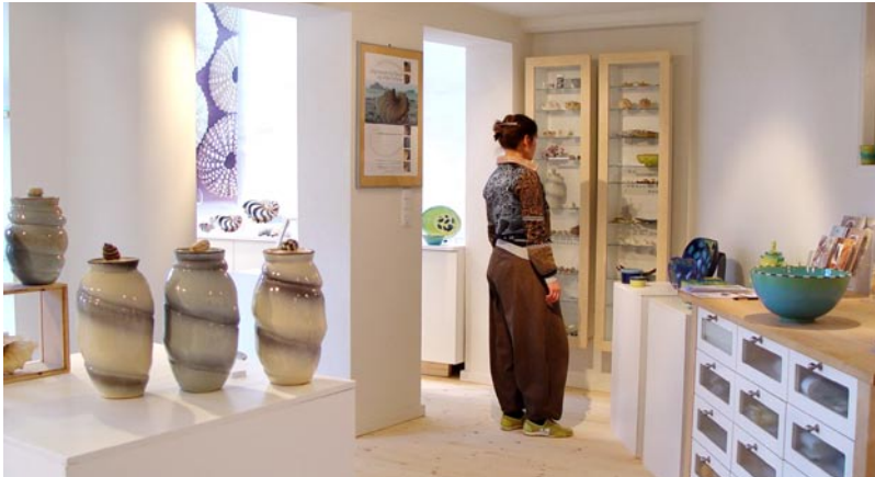
Min nye butik er blevet et stort og lyst galleri til alle mine værker, med plads til at fortælle historier.