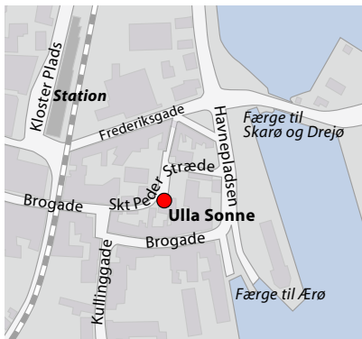
Ved at følge skiltningen mod færgerne til Ærø, Skarø og Drejø finder man ret nemt frem til butikken.