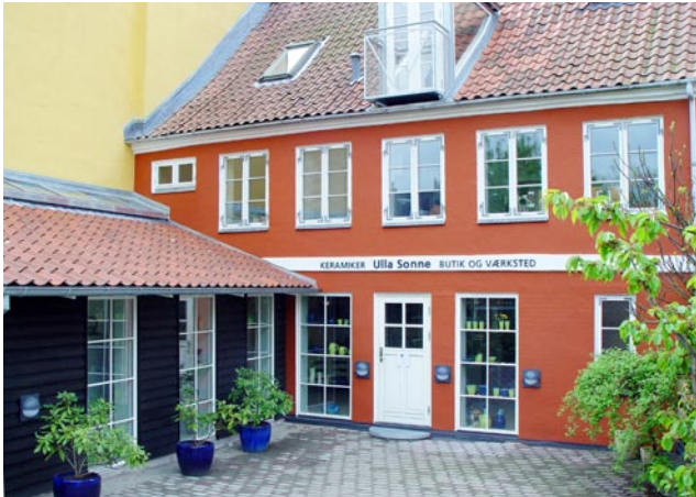
Facaden på vores nye hus. Hele stueetagen er indrettet til erhverv, og vores bolig ligger på 1. og 2. sal.

Det var ikke uden betænkeligheder, at min mand og jeg for godt et års tid siden traf beslutningen om at bryde op fra de trygge rammer i Kgs. Lyngby. Der havde vi haft bopæl og arbejde i 18 år, et dejligt hus, gode naboer, rare omgivelser, og - for mit vedkommende - en trofast kundeskare, lige som min mand havde sit faste arbejde på DR. Og vi var ikke tvunget til at opgive noget af det.